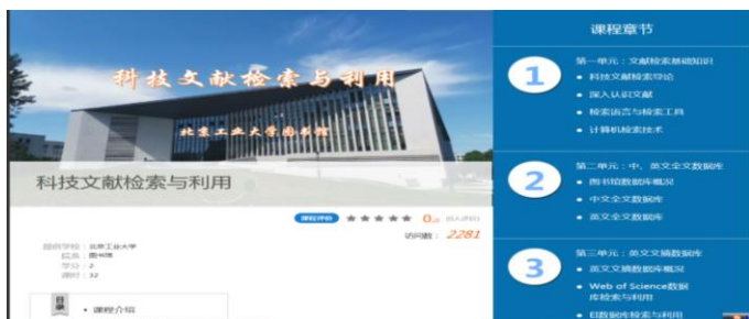
网络教学平台界面